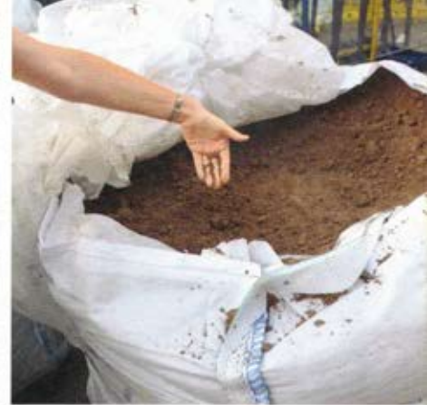
Fast 70 Tonnen Lehm wurden für den Raum der Stille verbaut – so entstand ein runder Raum auf einem quadratischen Grundriss.

werke hoch, aber auch in Deutschland finden sich größere Lehmbauten. So steht etwa in Haigerloch ein Gebäude mit 6 Stockwerken, errichtet im Jahr 1904!